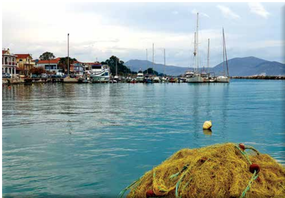
Άποψη του Ληξουρίου / View of Lixouri